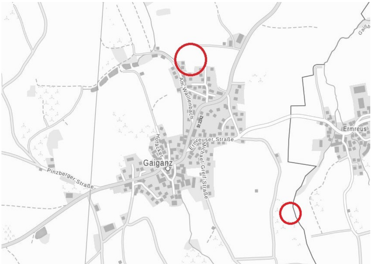
Übersichtslageplan mit Baufläche (großer Kreis) und Ausgleichsfläche (kleiner Kreis)

Der Gemeinderat der Gemeinde Effeltrich hat am 11.09.2023 beschlossen, für den Bereich des Bebauungsplans „Gaiganz Nord 1“ den Flächennutzungsplan entsprechend zu ändern. Vorgesehen ist die Aufplanung eines allgemeinen Wohngebietes. Da dieser Bereich in der vorbereitenden Bauleitplanung (Flächennutzungsplan) als Fläche für die Landwirtschaft ausgewiesen ist, muss im Flächennutzungsplan eine Änderung in Wohnbaufläche vorgenommen werden. Zusätzlich wird bisherige Fläche für die Landwirtschaft in Fläche für Maßnahmen zum Schutz, zur Pflege und zur Entwicklung von Natur und Landschaft (= Ausgleichsfläche) geändert. Die Lage der beiden Änderungsbereiche kann dem nachfolgenden Übersichtslageplan entnommen werden (s. nachfolgenden Übersichtslageplan).