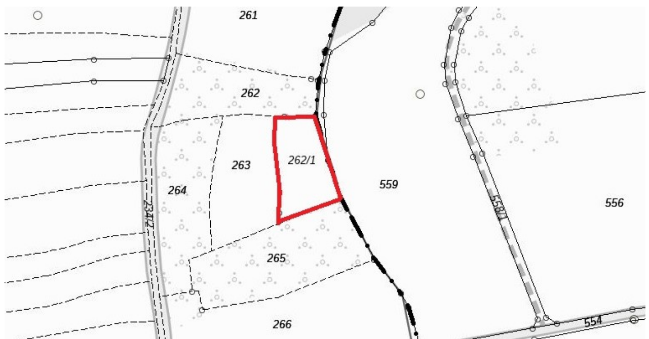
Detaillageplan Ausgleichsfläche Flur-Nr. 262/1, Gmkg. Gaiganz

Zusätzlich wird der Bauleitplanung als externe Ausgleichsfläche für naturschutzfachliche Maßnahmen die Flur-Nr. 262/1, Gemarkung Gaiganz, zugeordnet (s. nachfolgenden Lageplan).